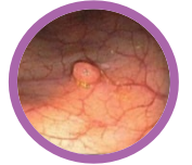
Pólipo en colon